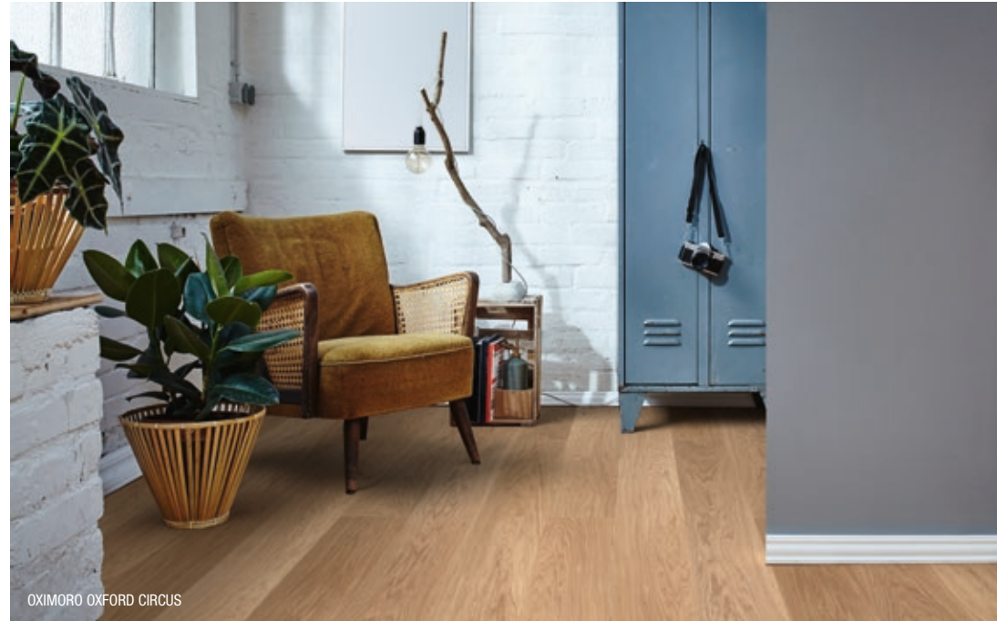
OXIMORO OXFORD CIRCUS

With the introduction of Oximoro Oxford , dry installation of wooden floors is made even easier, reducing time and allowing installation on imperfect substrates or existing floors. Thanks to its VLS (Vertical Lock System) interlocking technology, typical of engineered products, Oximoro Oxford guarantees an optimal holding, fast installation and a truly innovative application result for the world of wooden flooring.