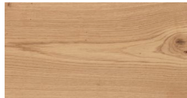
CORN RUSTICO CL*