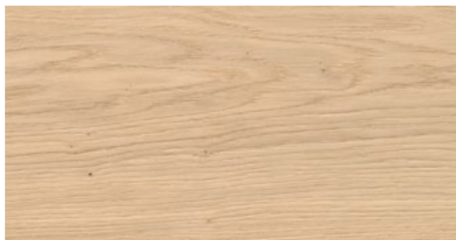
REGENT NATURE CL*