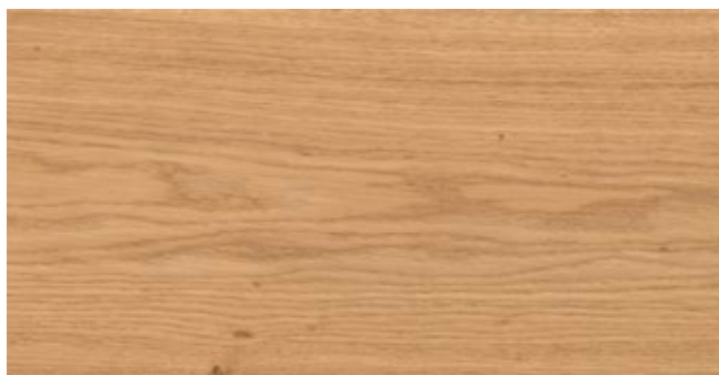
CIRCUS NATURE CL*