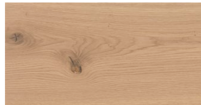
ABBAY RUSTICO CL*